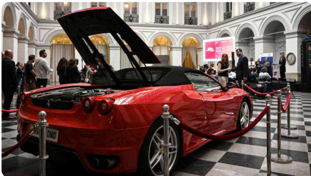
Une Ferrari Spider F430 revendue aux enchères après saisie, en juillet 2024.

Publié le 29/06/2026 à 07:12 - Mis à jour le 29/06/2026 à 07:12